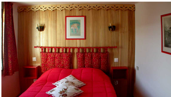
Dormitori C encarada al sud

L'entorn és molt tranquil al vell poble de Dorres. La vista dóna sobre les muntanyes de la Cerdanya.